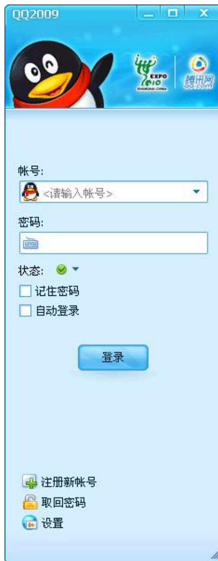
图 3 QQ 新版本的 2009 风格登录界面