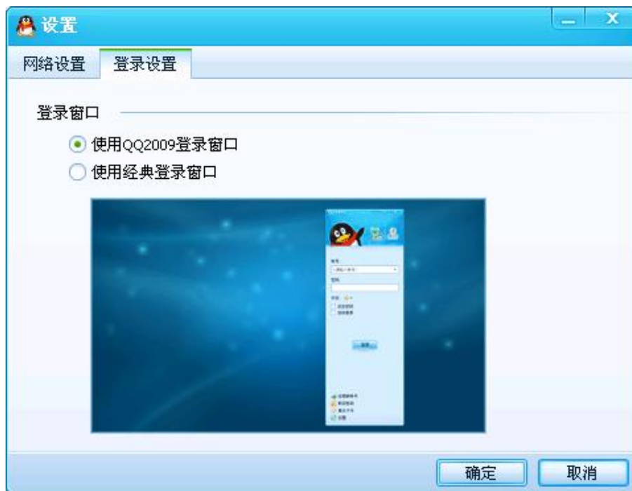
图 4 QQ 新版本的登录风格设置