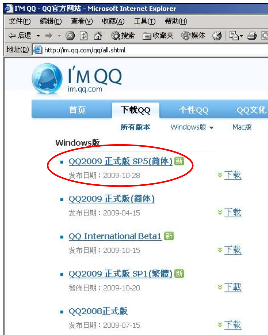
图 1 QQ 版本号

QQ2009 SP5 版本的登录风格有两种，一种是经典风格（见图 2），一种是 2009 风格（见图 3）。QQ 快车[1.0]适用的是类似于 MSN 的 2009 风格，不是默认的经典风格，所以必须先对 QQ 进行设置。设置方法：启动 QQ（不必登录）后，“设置”－“登录设置”，见图 4。