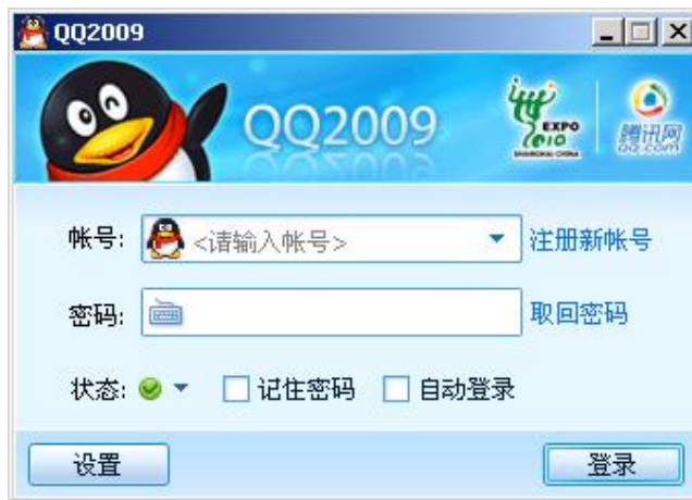
图 2 QQ 新版本的经典登录界面